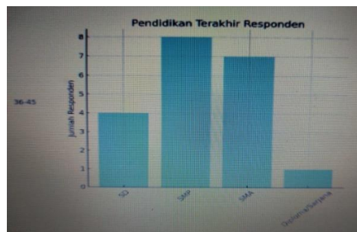
Gambar 2. Diagram Responden Berdasarkan Tingkat Pendidikan

Namun, potensi usia produktif ini berbanding terbalik dengan latar belakang pendidikan formal. Data menunjukkan bahwa 40% responden adalah lulusan SMP dan 20% lulusan SD. Keterbatasan pendidikan ini menjadi tantangan tersendiri bagi tim pengabdian dalam menyusun strategi komunikasi. Rendahnya tingkat pendidikan formal berkorelasi langsung dengan rendahnya literasi finansial dan manajerial pada tahap pra-intervensi. Hal ini mengonfirmasi bahwa rumah tangga miskin di perkotaan Medan terjebak dalam kemiskinan struktural yang berakar pada rendahnya akses pendidikan kualitas, sehingga mereka hanya mampu mengakses sektor pekerjaan informal yang tidak memerlukan kualifikasi khusus.