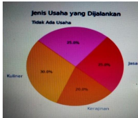
Gambar 3. Diagram Responden Berdasarkan Jenis Usaha