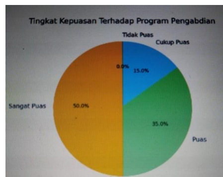
Gambar 5. Diagram Kepuasan Responden Terhadap Pelaksanaan Kegiatan

Efektivitas program juga tercermin dari tingkat kepuasan mitra yang sangat tinggi, di mana 50% menyatakan sangat puas dan 35% menyatakan puas. Kepuasan ini bukan hanya karena adanya peningkatan materi, tetapi juga karena peningkatan rasa percaya diri (self-efficacy). Mitra merasa lebih dihargai dan memiliki harapan baru untuk keluar dari jerat kemiskinan. Perubahan perilaku yang paling menonjol adalah kedisiplinan dalam melakukan pencatatan keuangan harian melalui buku kas sederhana yang diberikan oleh tim pengabdian. Perilaku ini merupakan fondasi utama bagi keberlanjutan usaha mikro dalam jangka panjang.